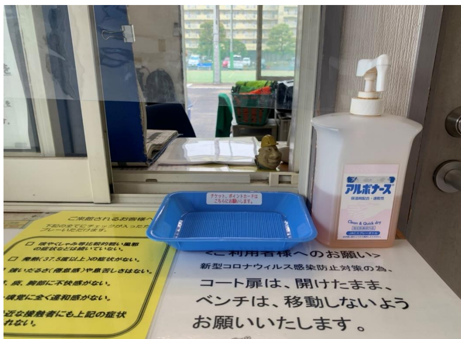
▲受付ビニールカーテンと消毒液の設置