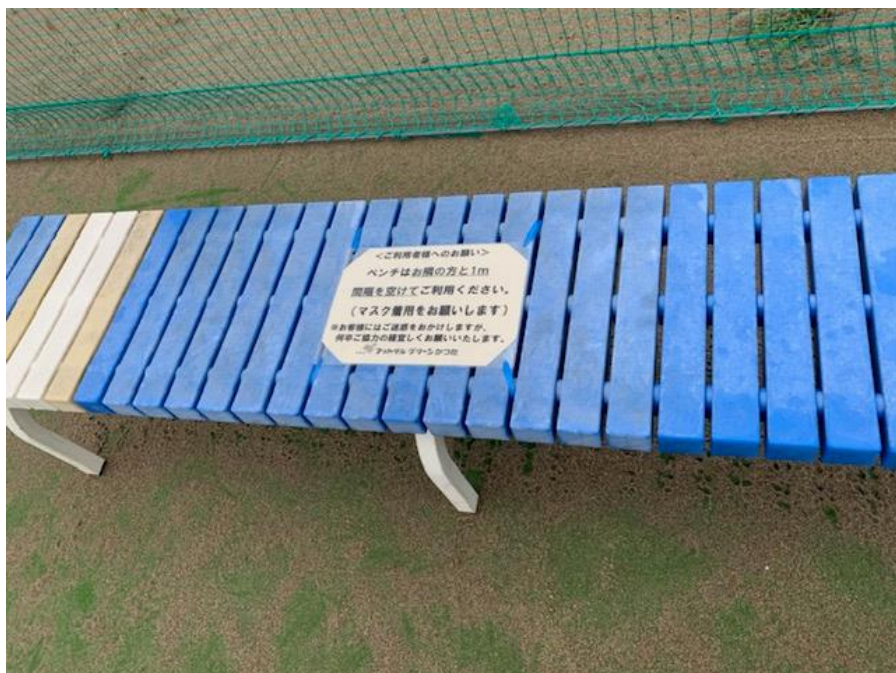
▲密集・密接防止 間を空けて座りましょう