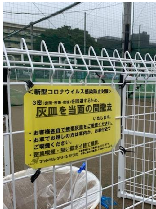
▲密集・密接防止 灰皿の撤去