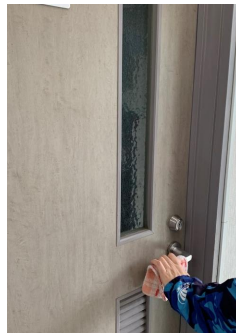
▲スタッフによる消毒