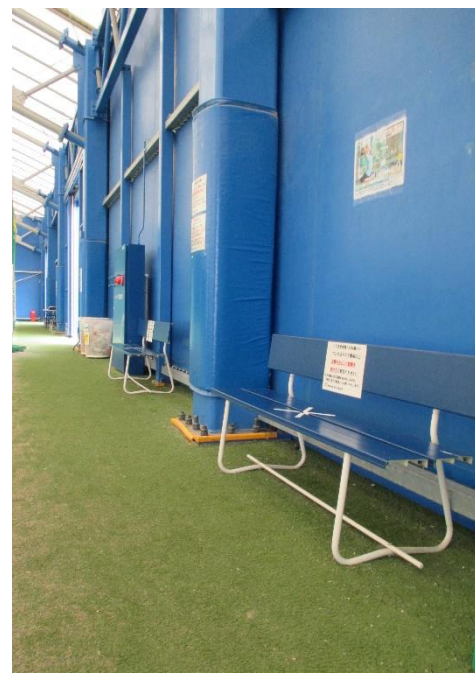
▲密集・密接防止 間を空けて座りましょう