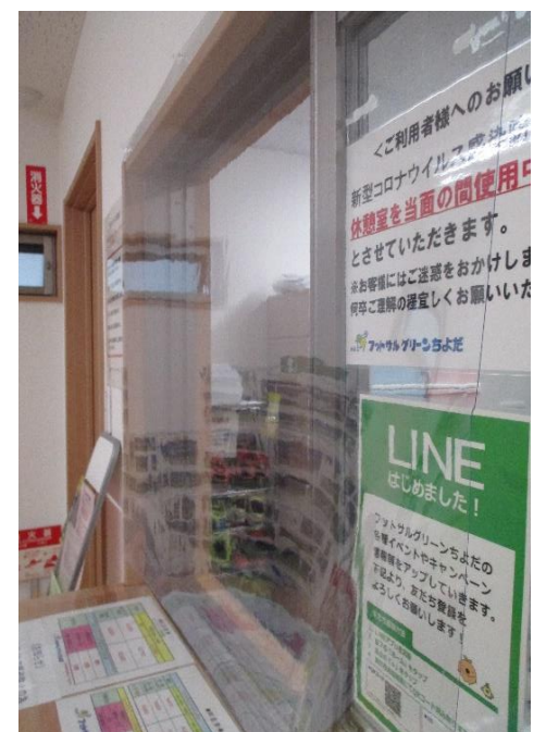
▲受付ビニールカーテンの設置