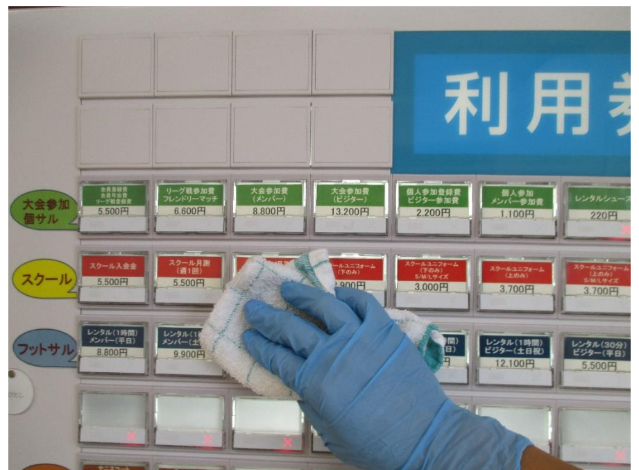
▲スタッフによる消毒