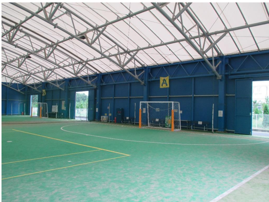
▲屋内コートの換気